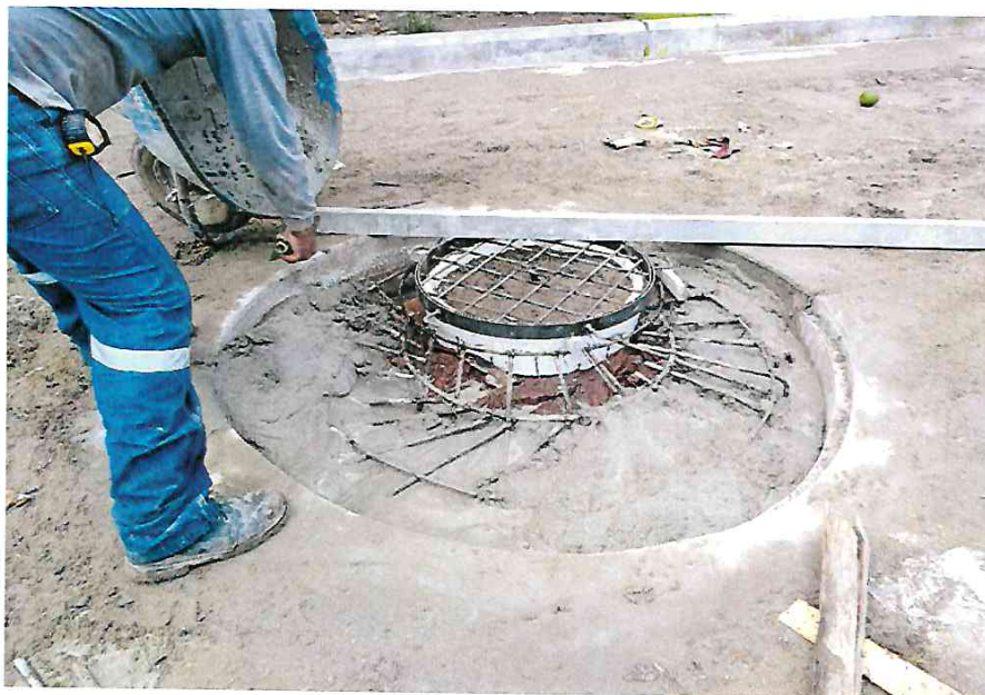
- Llenado con mortero f'c=210 kg/cm 2 en tapa de buzón a nivel de rasante.