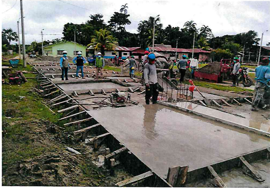
- Llenado de losa de rodadura con mortero f'c=210 kg/cm 2