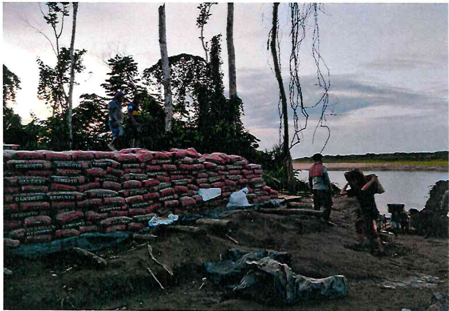
- Transporte de materiales como, cemento, acero de 3/8" 1/2" 5/8".