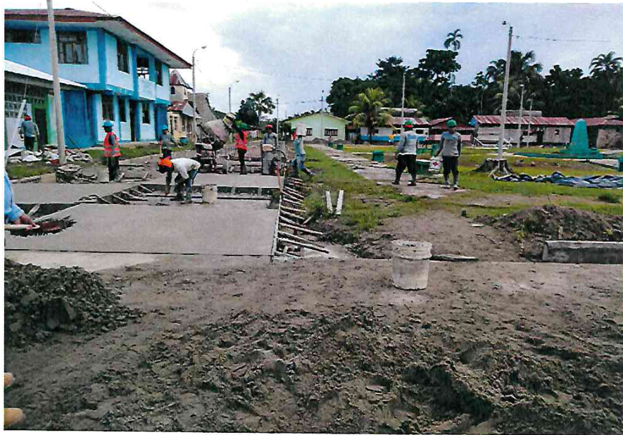
- Llenado de losa de rodadura con mortero f'c=210 kg/cm 2 y acabado final.