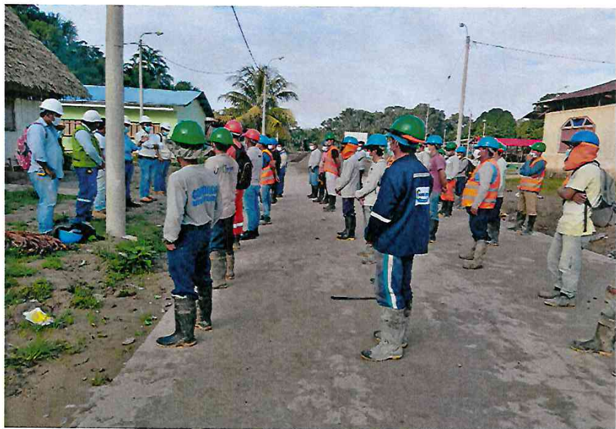
- Charla de seguridad y salud ocupacional, capacitación a todo el personal obrero sobre las partidas que se ejecutaran durante el día.