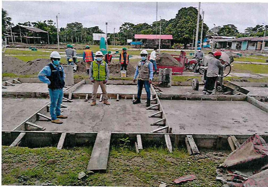
- Verificación y aprobación de los trabajos in situ por parte del Ing. supervisor sobre los trabajos que se realizan a diario en obra.